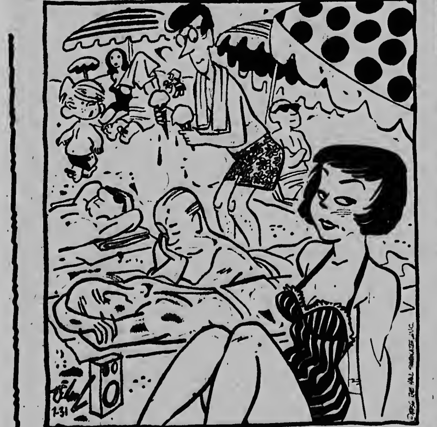
Papa, kom. Daar zit moeder niet . . . . Papa bini aki; mama no ta ey banda